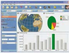
Überblick leicht gemacht: TARGET Analysis im Einsatz

zu können. Doch die wahren Potenziale – ganz gleich ob Kampagnen oder Marketing – liegen nicht in den Kennzahlen der letzten vier Wochen, sondern in den Kennzahlen der nächsten vier Wochen. Wenn diese branchenübergreifenden Fähigkeiten im Unternehmen erakzioniert werden sollen, stellt sich die Frage, wie und zu welchen Kosten sich diese Potenziale aktivieren lassen. Und die entscheidende Frage in diesem Zusammenhang lautet: „Wie hat das mit BI zu tun?“ Die Antwort „Allen“ BI nicht für die Unterstützung der operativen Geschäftsprozesse und ist eine elementare Voraussetzung auf dem Weg zu einem betriebsinternen Unternehmen. Daher muss BI entlang der Geschäftsprozesse eingesetzt werden – im Idealfall bei allen Mitarbeitern im Unternehmen. Viele Äußerungen von operativen Systemen, wie etwa Microsoft Business Solutions, integrieren solche Funktionen, liefern ein gewisses Grund in ihre Systeme. Nur, wenn ein geringes Schulungsaufwand Mitarbeiter aller Ebenen die Werkzeuge einsetzen können, lassen sich die Potenziale aktivieren. SigoCon bietet in ihrer exklusiven Zusammenarbeit mit der deutschen Target AG praktische Funktionen. Sie ist im letzten Maße dabei und stellt sich auch auf die Anforderungen der Anwender ein. Diese so genannte Maßnahmenplanung-Ansätze wird weitergeführt durch die wesentlichen Analysefunktionen, die selbstständig geführte Form der Analyse- und Berichterstattung liefern.