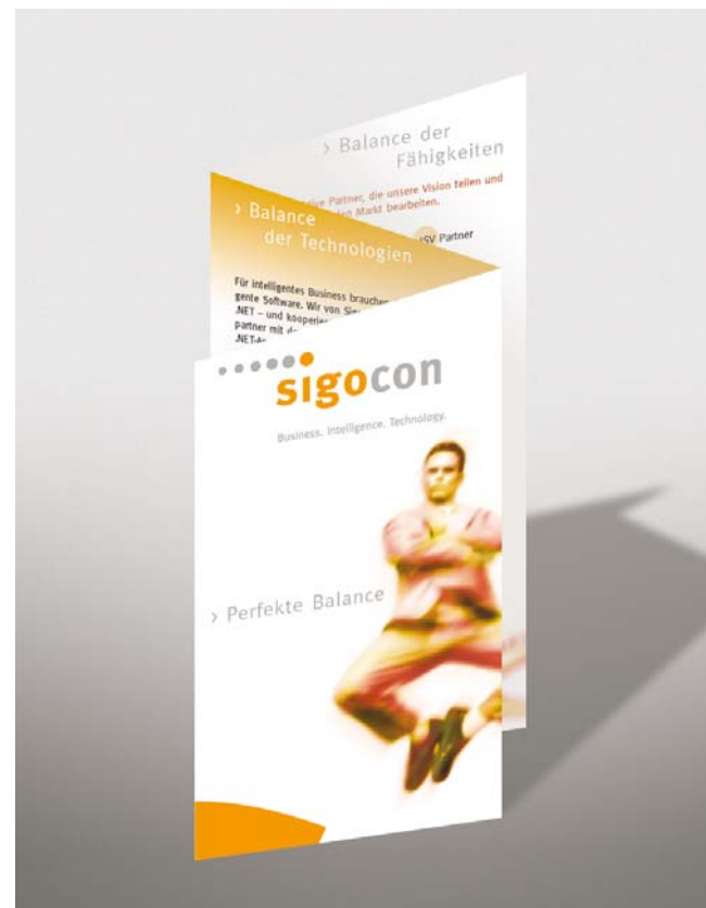
Der SigoCon-Flyer gab zur CeBIT eine gute Figur ab

Für die Website wurde ein inhaltliches Konzept gemäß der Positionierung der Firmengruppe entwickelt und nach den CD-Richtlinien ein