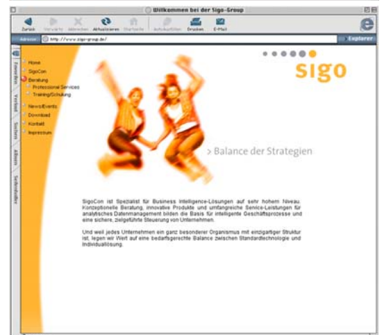
Als Identifikationselement wurden die Key-Visuals auf der Website eingesetzt