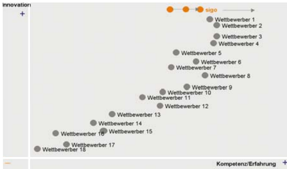
Die Positionierung von Sigo im Wahrnehmungsumfeld des Wettbewerbs