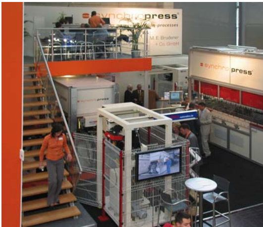
2-geschossig: Synchropress-Messestand auf der EuroBlech