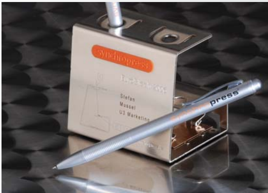
Der Stifthalter wurde am Messestand auf der EuroBlech als Giveaway: hergestellt und mit den Namen der Besucher versehen

und dominiert die ähnlich einem Informations-Portal gestaltete Seite. Der Betrachter findet hier technische Daten und Download-Bereiche, die auch den Demo-Film verfügbar machen.