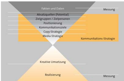
Das U3-Strategiemodell führt zu einer punktgenauen Markenpositionierung