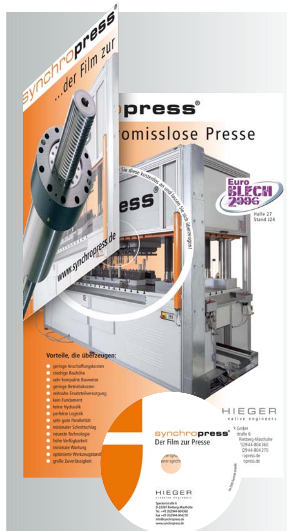
Messebegleitende Anzeigen stellen Fachleuten einen eindrucksvollen Demo-Film auf DVD zur Verfügung

Die Website dient möglichen Interessenten in erster Linie mit Information über das Produkt und gibt Hinweise auf Demonstrations-Veranstaltungen. Auch hier ist die „synchropress“ in den Fokus gerückt